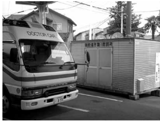
平時から必要な防護備品の備蓄を

今後は、防災担当と連携し、自己防衛手段として使い捨てマスクや消毒剤等を家庭や事業所で備蓄するよう広報していく。